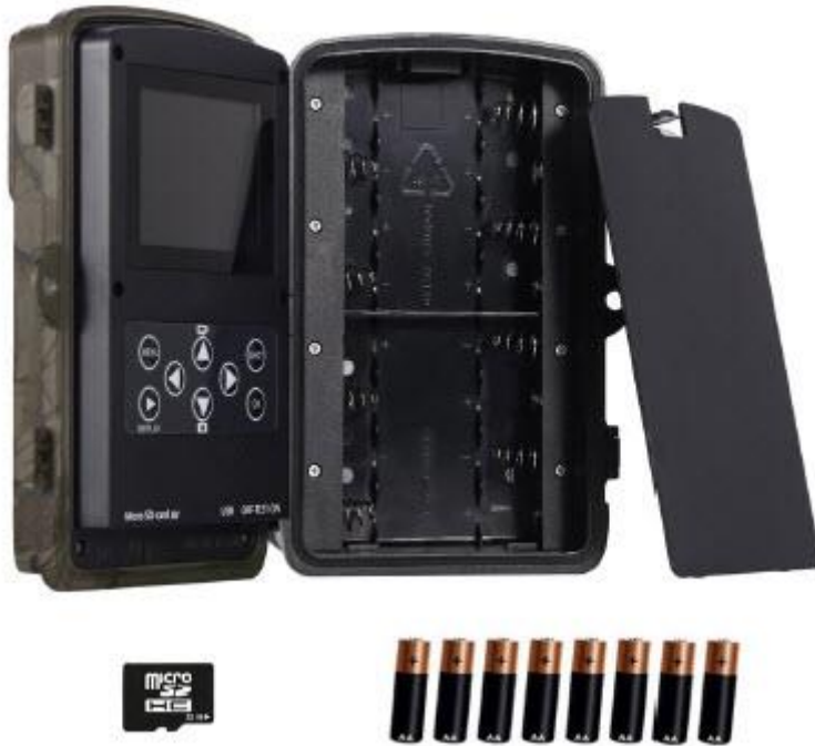
Karta Micro SD 32 GB 8 x bateria AA